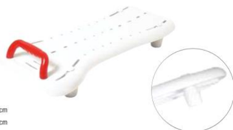
Tavola da vasca con maniglia colorata dotata di morsetti di fissaggio in gomma speciale che garantiscono un grip maggiorato. La seduta presenta fori di deflusso dell'acqua che consentono un rapido asciugamento dopo l'uso ed evitano l'accumulo di sporco. Dotata di incavo portasapone , la tavola ha una tenuta che la rende fruibile ad utenti di peso elevato.